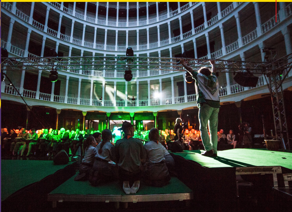
Gala Niezwyčajnych 2015 od kulis – więcej na str. 10-17