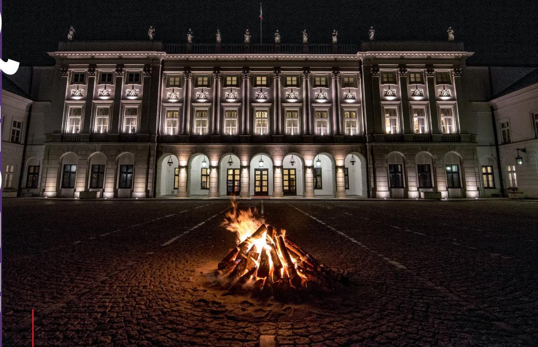
Watra przed Pałacem Prezydenckim – więcej o protektoracie Prezydenta RP na str. 6-7